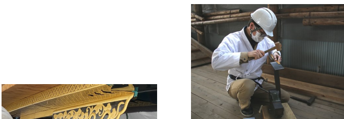
▲ 鏝金具の形を整える