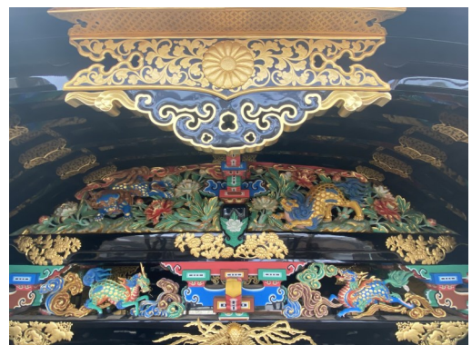
▲ 取付後の唐破風下（北）