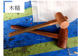
▲ 使用する道具 ▲