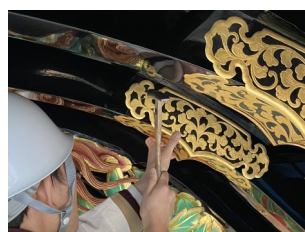
▲ 鏝金具を取り付ける