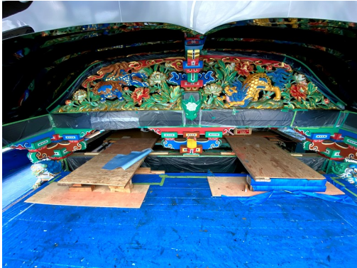
▲ 取付前の唐破風下（北）