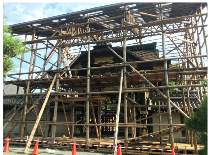
▲ 丸太で組まれた素屋根の骨組み