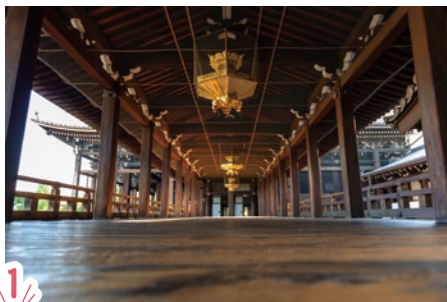
1 夕日が差し込むとキレイに撮れる渡り廊下。