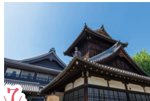
7 新撰組ゆかりの太鼓楼。