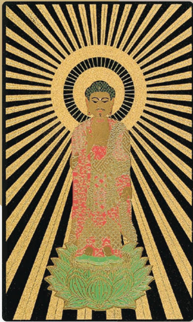
縦90mm×横55mm×厚み2mm 漆ブラック調バイオプラスチック

携行本尊とは、「独りじゃないよ、いつも一緒だよ」と、よびかけてくださる阿弥陀さまをいつでもどんな時でも感じられるよう、持ち歩くことができる名刺サイズの御本尊です。ご自身のために、また遠く離れて暮らす家族のために、ぜひお求めください。西本願寺(龍虎殿)で直接お求めいただけるほか、ホームページからのお申込みも可能です。