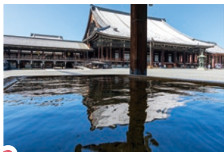
2 水面に映る阿彌陀堂がキレイな映えスポット！