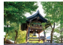
13 毎朝5:30に撞かれる梵鐘。