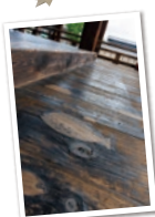
8 縁側にはたくさんの埋め木があります。あなたのお気に入りの木を探してください。