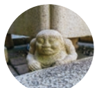
14 愛嬌たっぷりあまじゃく天の邪鬼！