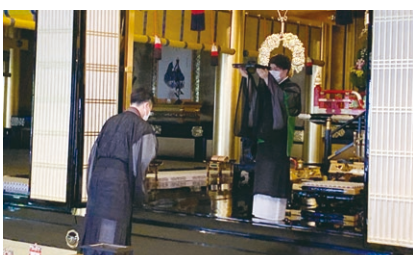
ほうみょうほういでい 法名奉呈の様子(阿弥陀堂)

その懇志は、法座(ご法話を聞く機会)や諸堂の維持など、お寺が存続し、「み教えがますますひろまるように」とのところで納められるものです。本願寺で永代経法要にお参りし、お念仏のみ教えを聞かせていただきます。